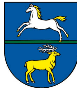
Obrázok 2 Erb obce

Erb obce Zemplínska Široká tvorí v hornej modrej polovici deleného štítu po zelenej, mierne oblej pažiti beží strieborný zlatohrivý kôň, v dolnej modrej polovici stojí vľavo otočený zlatý jeleň so striebornou zbrojou. Erb obce je zapísaný v Heraldickom registri SR pod signatúrou Z-40/1996.